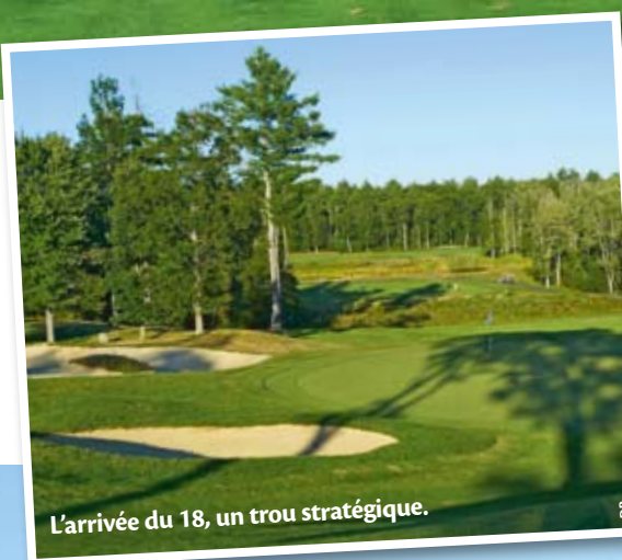
L'arrivée du 18, un trou stratégique.