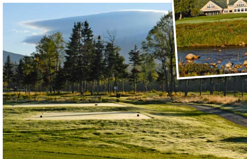
Saut de la rivière vers le green du 18 et le club-house.