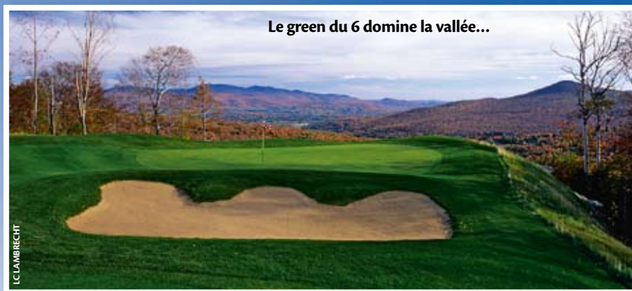
Le green du 6 domine la vallée...