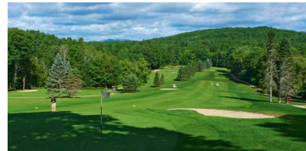
Arrivée majestueuse du 9, sur fond de montagne.