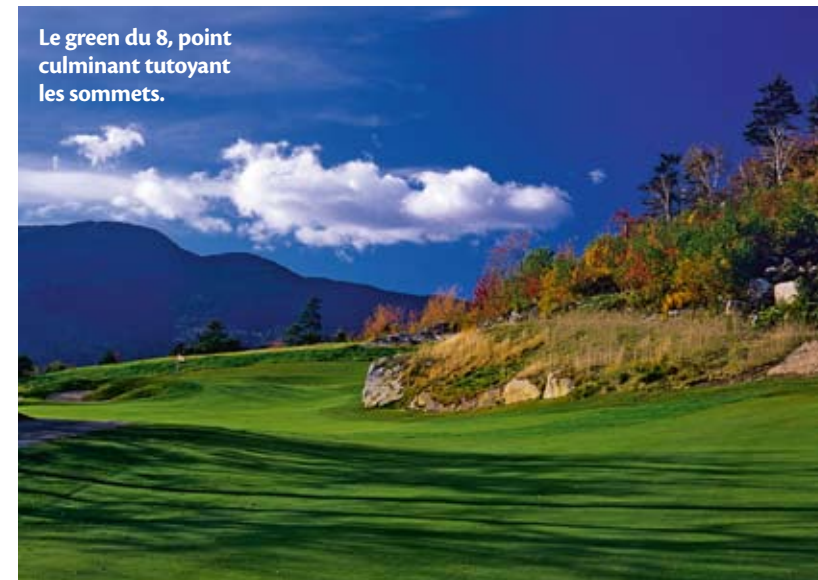
Le green du 8, point culminant tutoyant les sommets.