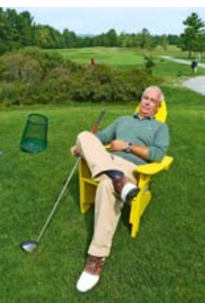
Les fauteuils Adirondack à chaque départ, la griffe du club... Tout comme les bernaches sur les greens!